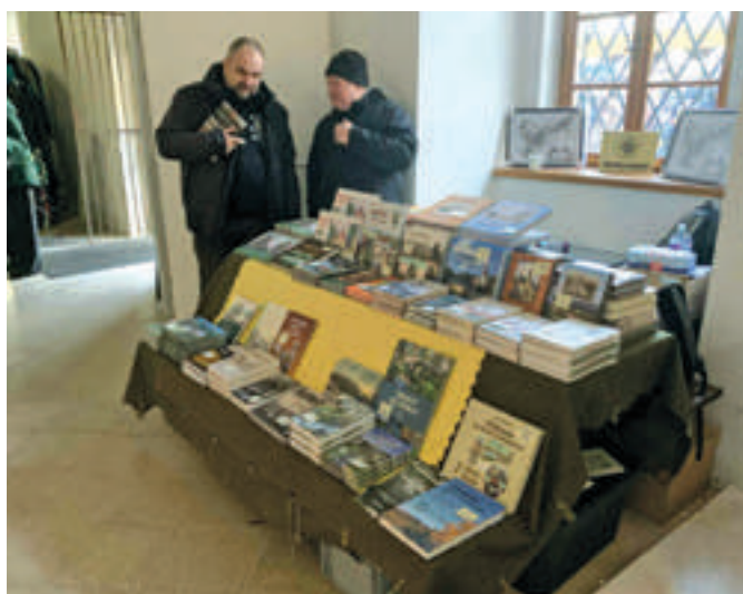
Nabídka knih Brdské edice