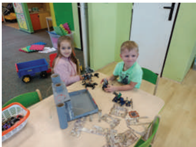
Hrad pro svatého Martina u Kořátek