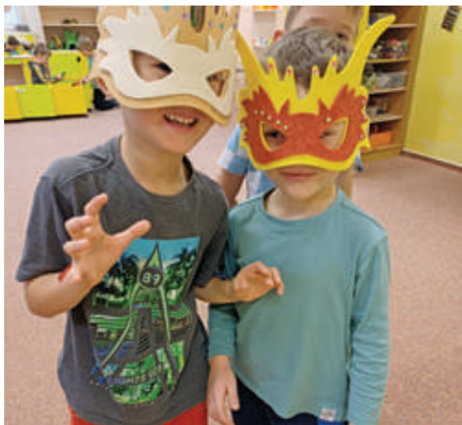
Draci ve třídě Sluníček

Ve třídě Sluníček se dlouho vzpomínalo na dračí stezku, děti vyráběly masky a dračí sluje. Svatý Martin přijel na bílém koni a připomněl jim důležitost dobrých skutků. Po 17. listopadu se snažily hledat klíče ke svobodě a radosti i ve své třídě. Vyslechly si pohádku O zemi, která hledala svobodu. Vysvětlovaly si pojmy – „svoboda, nesvoboda, demonstrace“, povídaly si o tom, co se všechno u nás dříve nesmělo.