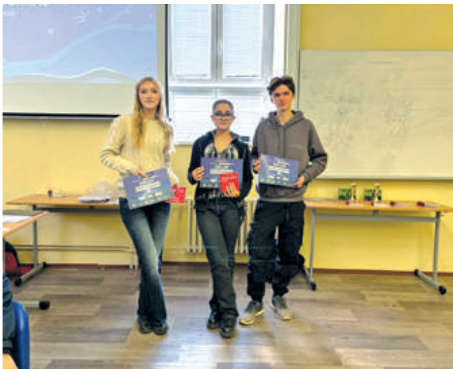
Postupující tým Jméno