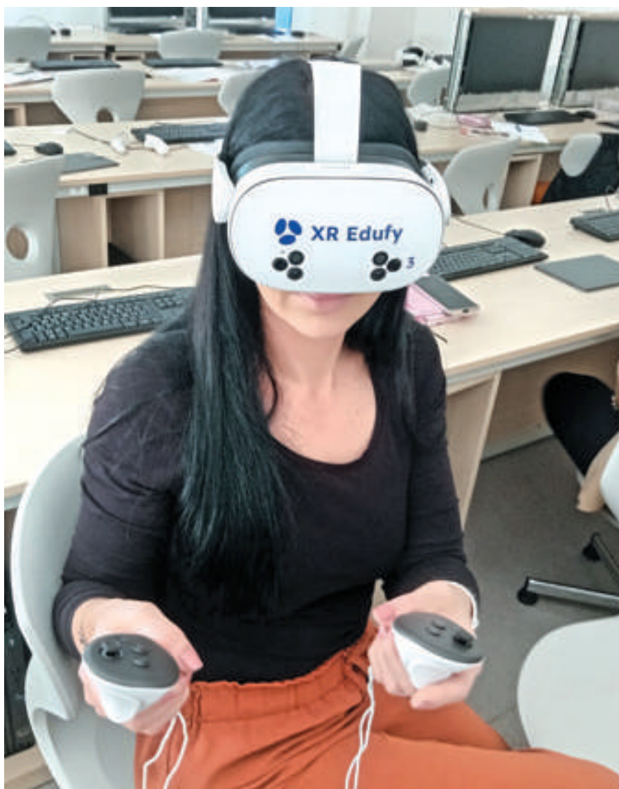
Školení virtuální reality pro pedagogy