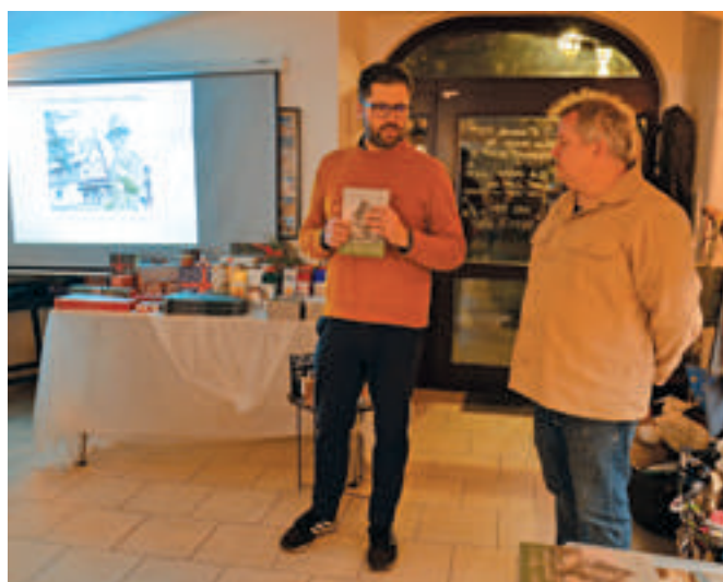
Krásný Krámek v Rokycanech