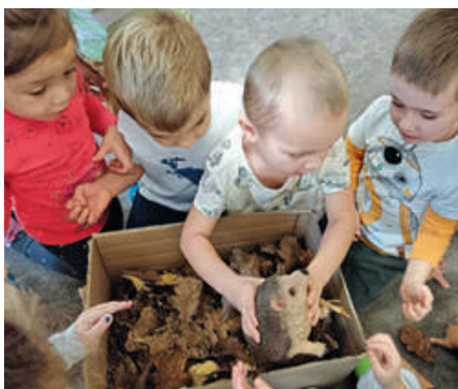
Návštěva ježčího kamaráda u Berušek