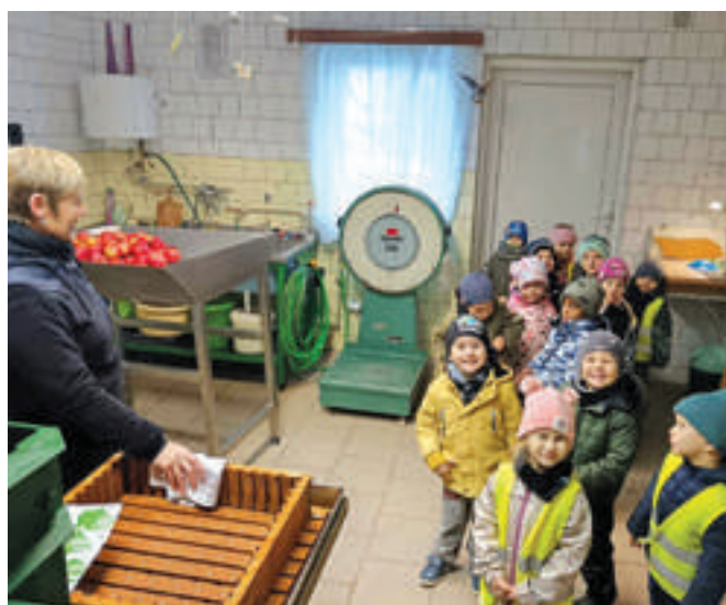
Berušky v moštárně