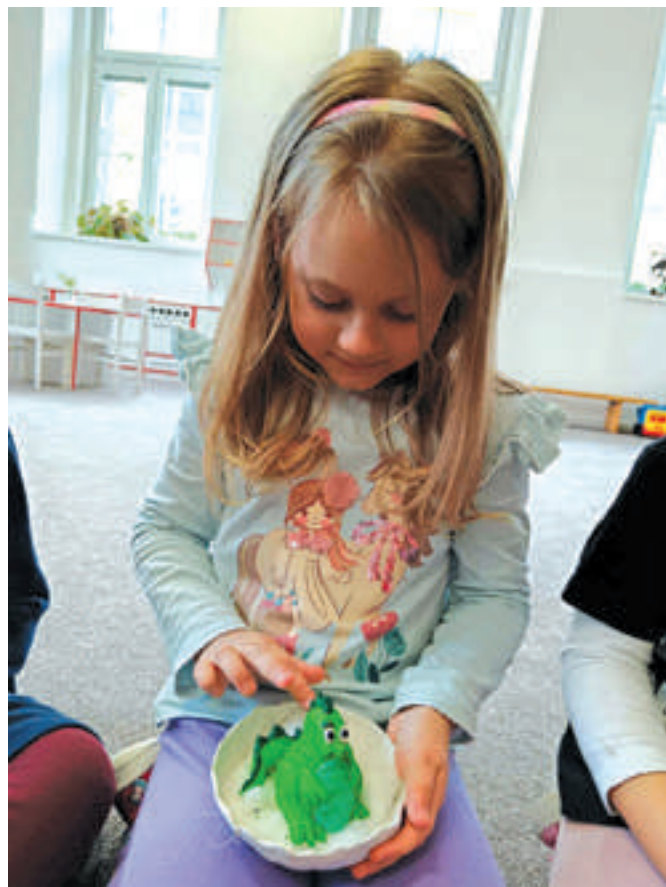
Líhnutí dráčka v Beruškách