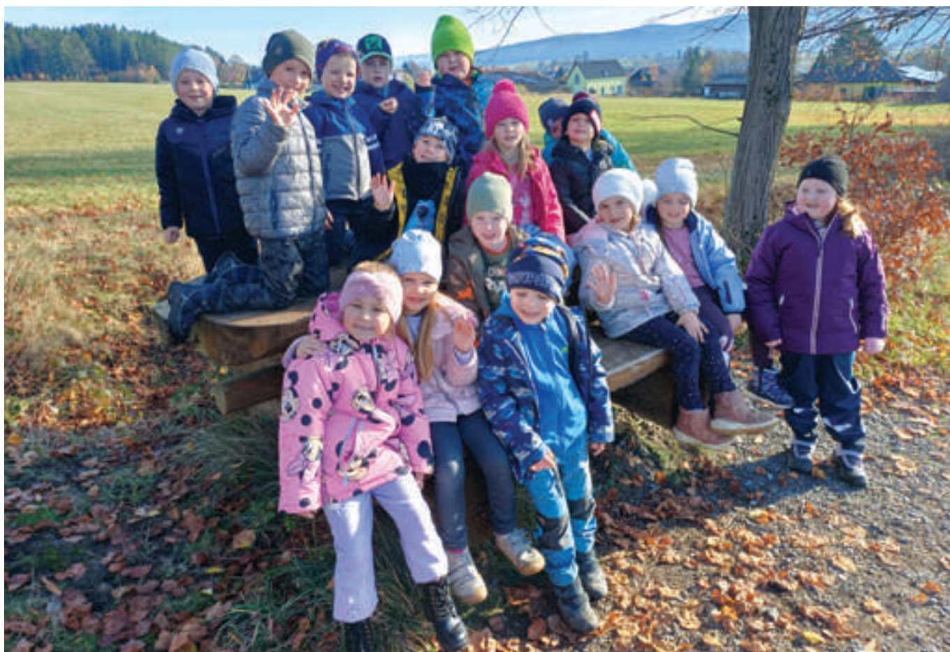
Sluníčka v přírodě