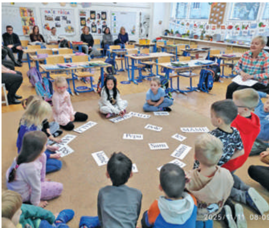
Den otevřených dveří v 1. třídách