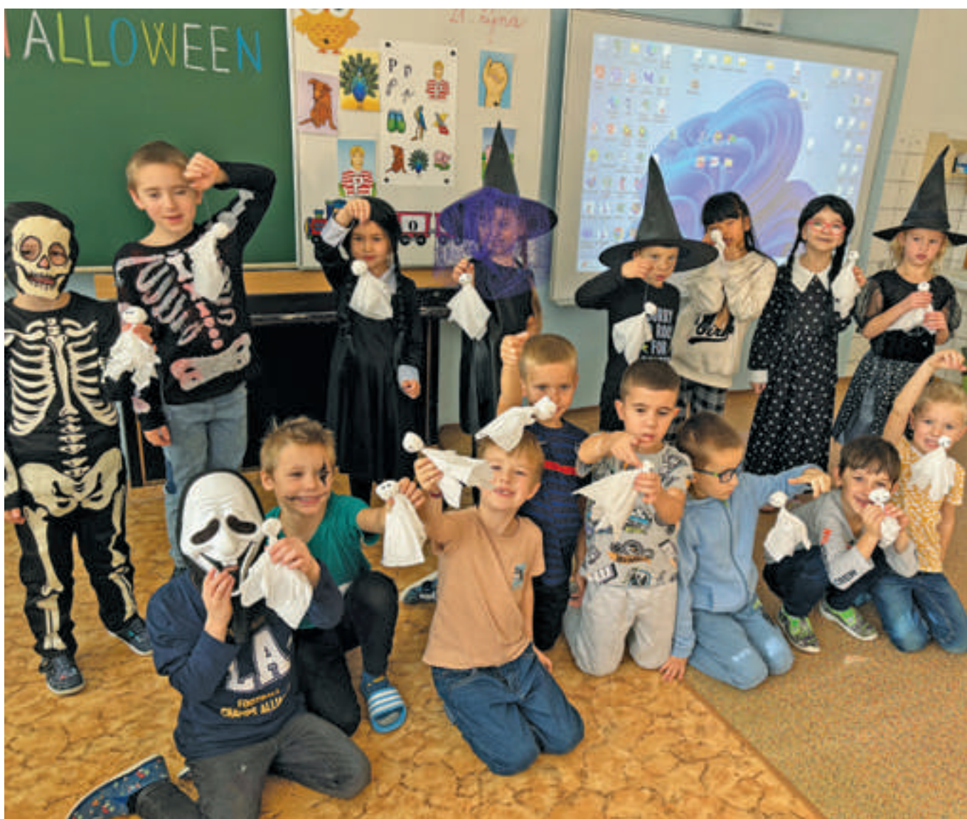
Halloweenský den na 1. stupni

Dne 31. října na 1. stupni naší školy proběhl projekt "Halloween", inspirovaný stejnojmenným známým anglosaským svátkem. S ranním příchodem žáků převlečených do stylových kostýmů se třídy naplnily kouzelnou až lehce strašidelnou atmosférou.