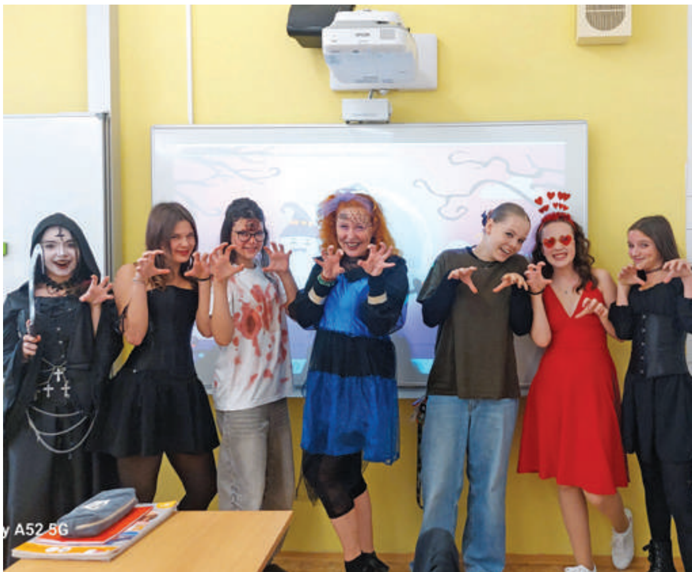
Halloween na druhém stupni