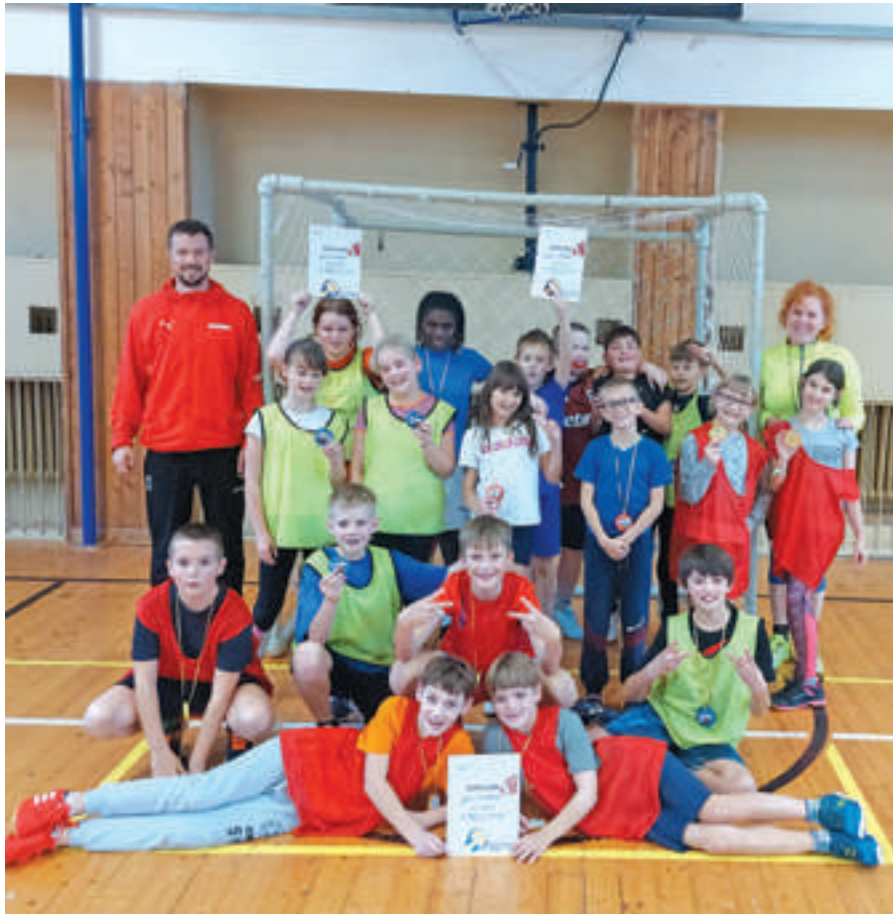
Házená na 1. stupni