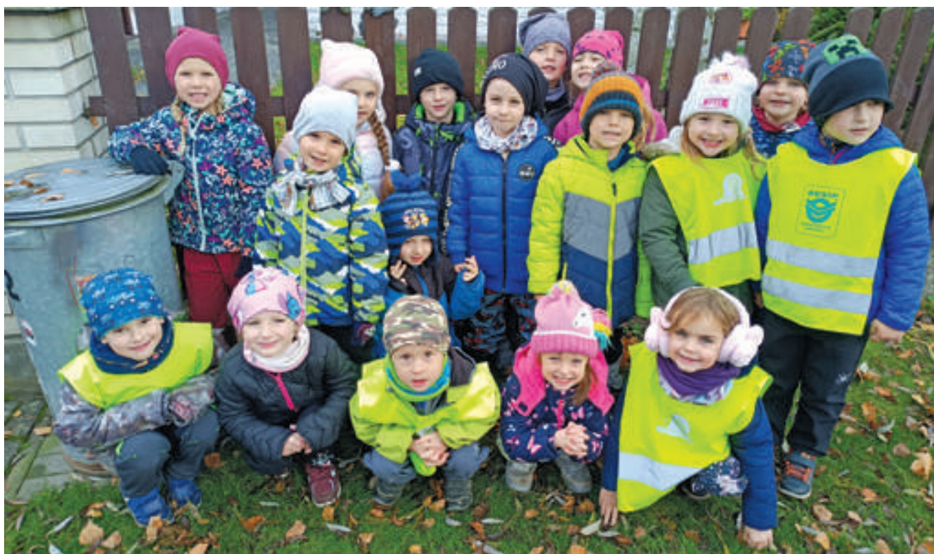
Třída Kotat na vycházce