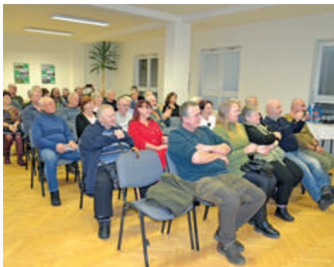
Malý sál Místní knihovny ve Strašicích