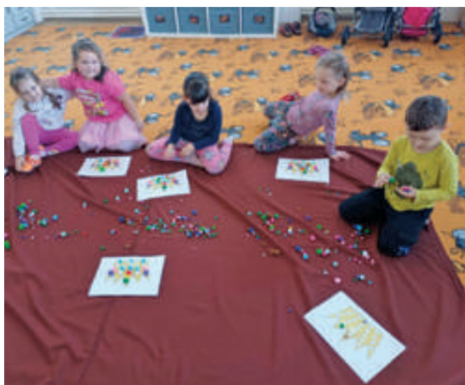
Draci a princezny v Myškách