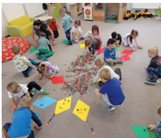
Stavění draků u Kytiček