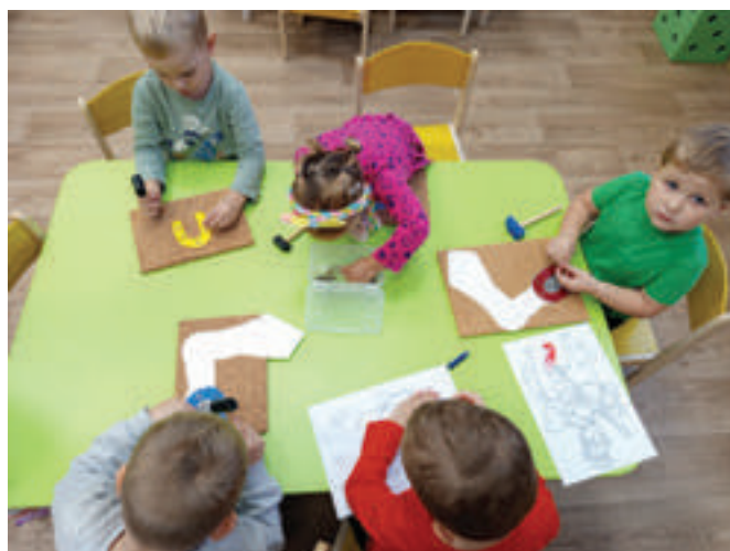
Kytičky kovájí koně