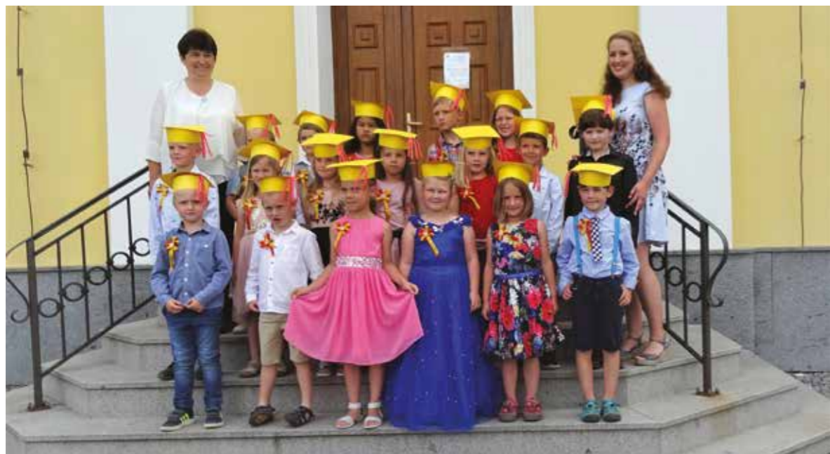
Přejeme šťastné školní roky