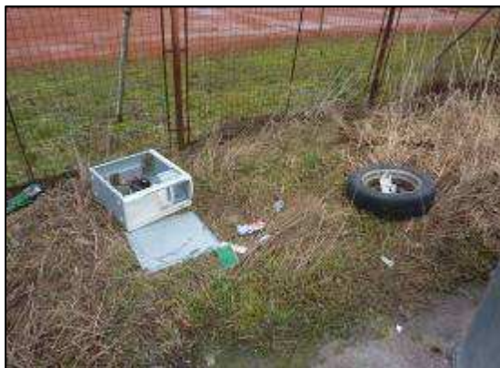
torzo PC, sídliště Spartak