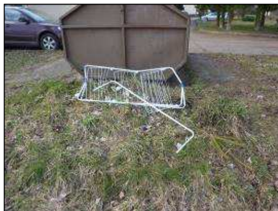
torzo sušáku, sídliště pošta