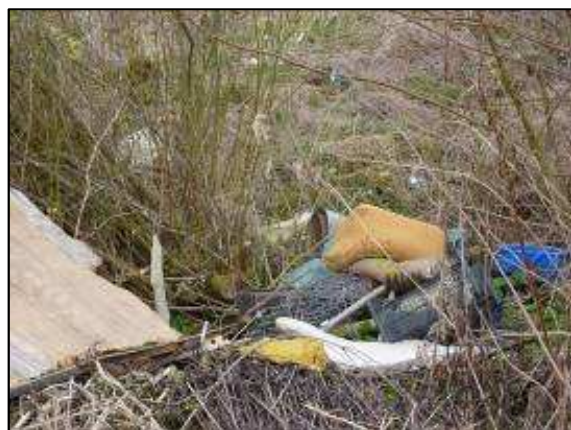
černá skládka za rybníčkem - zahrádky