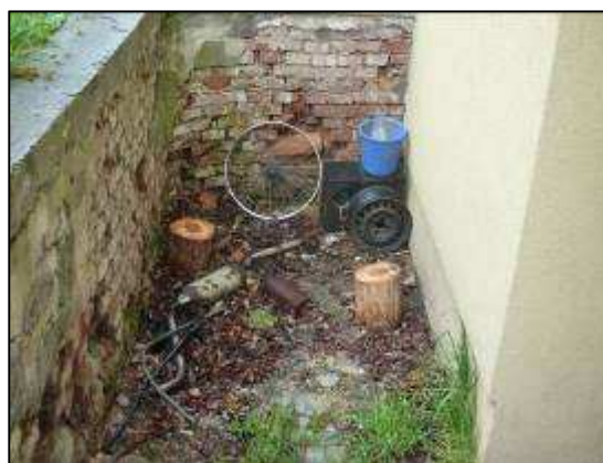
černá skládka -z boku domu č.464

Odkládání odpadů (likvidace) nepotřebného materiálu z domů, vytváření černých skládek po jednotlivých částech obce. Stále velký problém pro některé občany odvést věci do sběrného dvora.