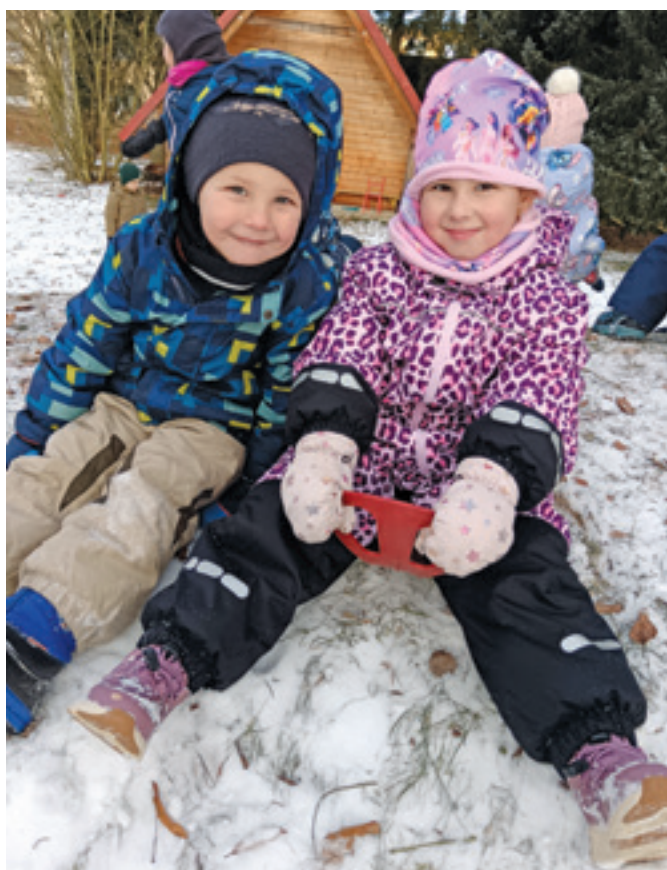
Zimní radovánky u Berušek