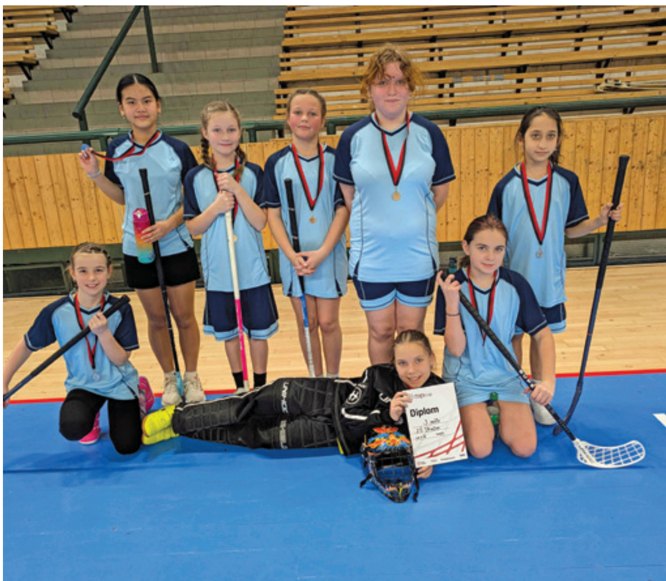
Florbalový turnaj dívek 1. stupně