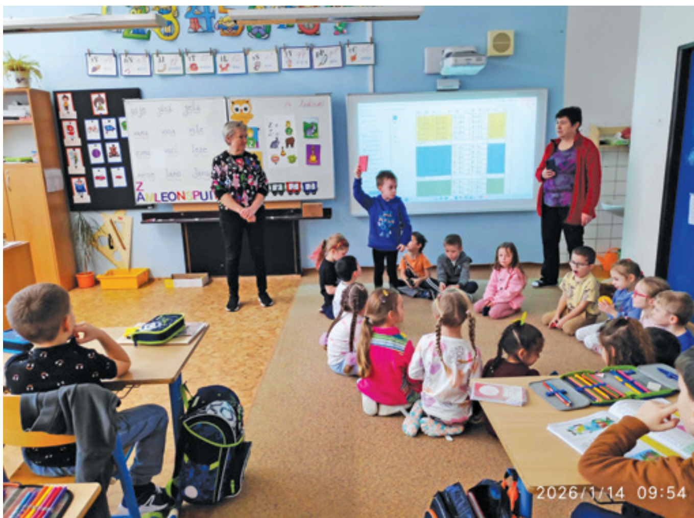
Návštěva mateřské školy v první třídě

Dne 14. ledna navštívily děti z mateřské školy hodinu matematiky v první třídě. Společné setkání proběhlo v příjemné a přátelské atmosféře, která podpořila spolupráci mezi předškoláky a školáky.