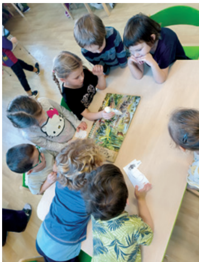
Koťátka a zajímavosti o dinosaurech