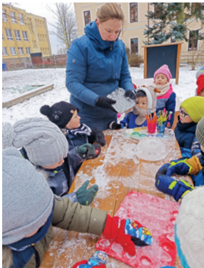
Kouzlení s ledem v Kytíčkách