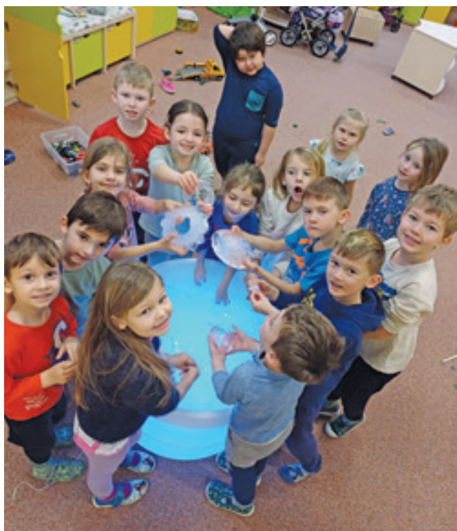
Ledové tvoření ve Sluníčkách