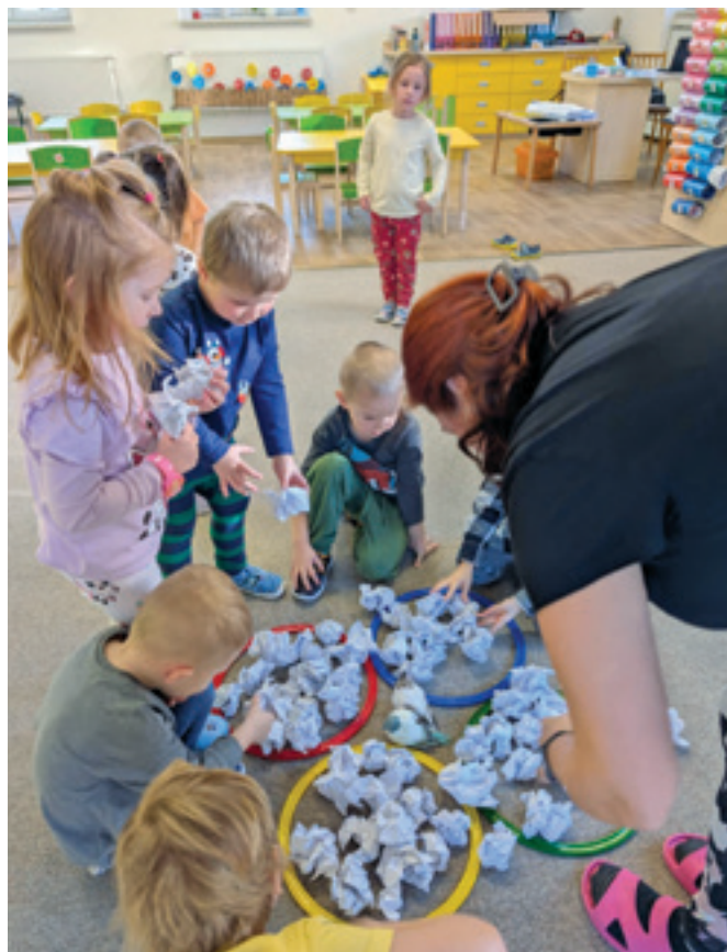
Zimní krmení ptáčků