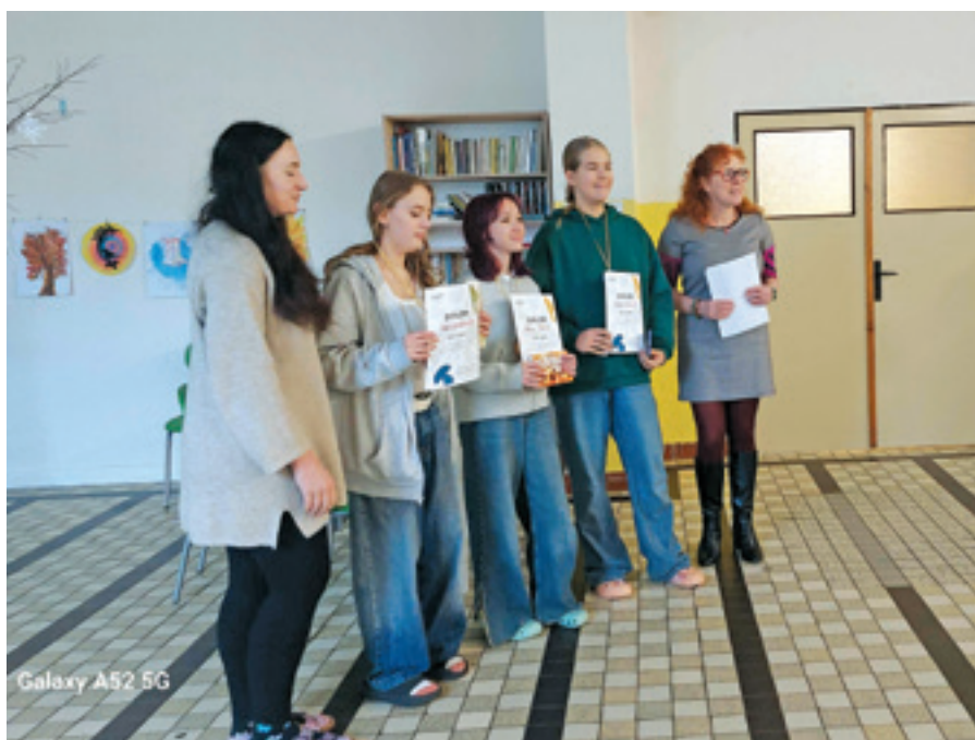
Školní kolo Konverzační soutěže

Ve čtvrtek dne 15. ledna se deset nejlepších uživatelů anglického jazyka naší školy sešlo v učebně angličtiny, aby prokázalo své dovednosti a schopnosti.