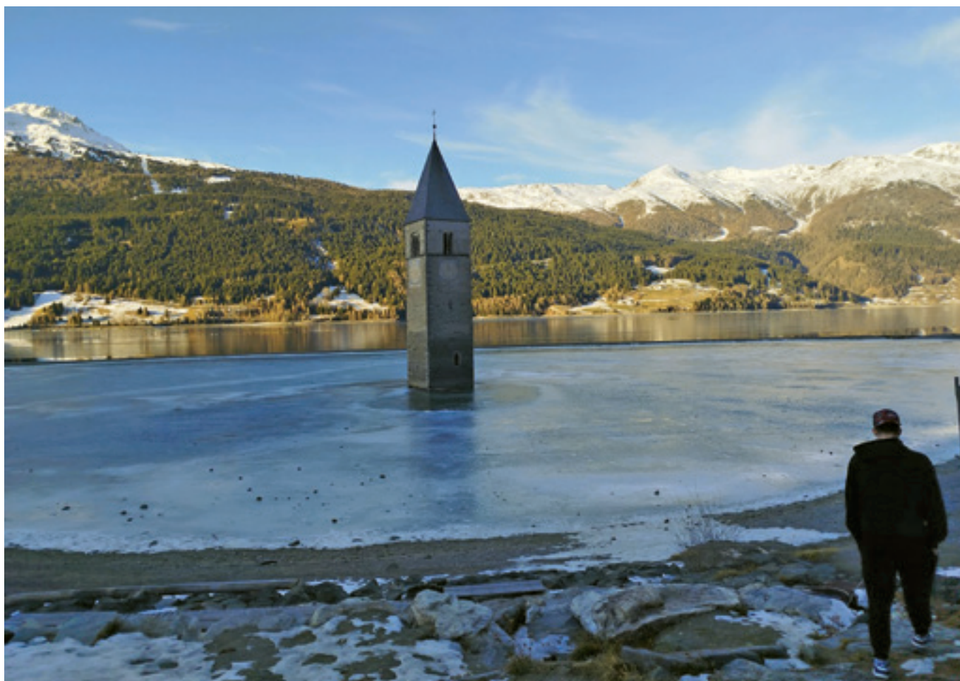
Moje foto – umělé jezero RESIA – Itálie