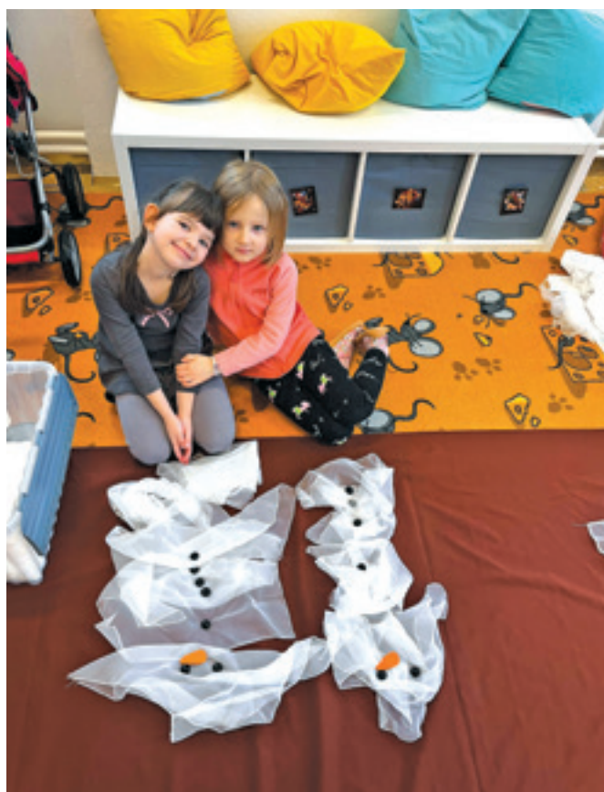
Myšky a tvoření sněhuláků