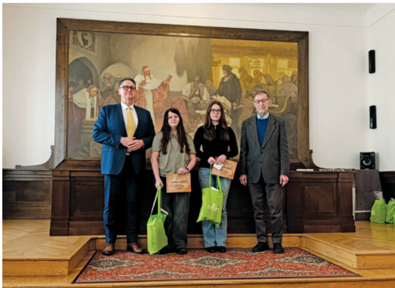
Výtvarná soutěž „Světtem pyramid“