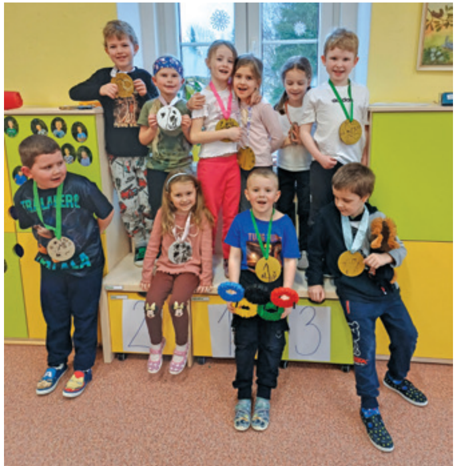
Olympijské hry ve Sluníčkách