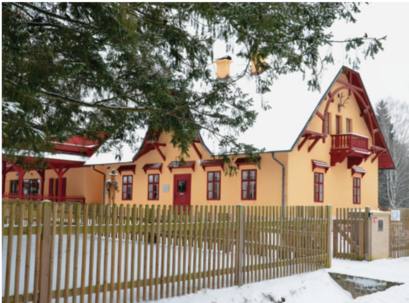
Dům přírody Brd

Dům přírody Brd zahajuje pomalu a jistě novou sezónu, ale ani první dva měsíce roku 2026 neznamenal výrazně klidnější období. Během těchto měsíců navštívilo areál více než osm set návštěvníků. Během všedních dnů se řešily objednávky společně s údržbou vnitřních i venkovních expozic, které doznaly četná opotřebení. Zájem o Dům přírody neopadá a v současnosti připravujeme další programy ve spolupráci s VLS a CHKO Brdy.