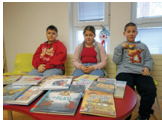
Návštěva strašické knihovny