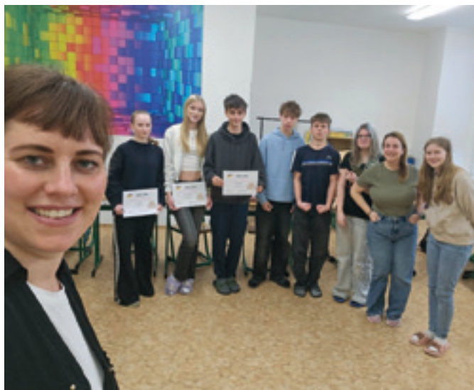
Konverzační soutěž v německém jazyce