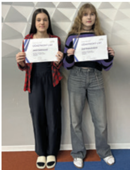
Okresní kolo Olympiády v českém jazyce