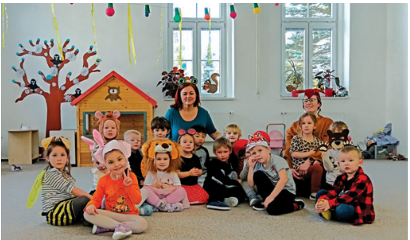
Maškární bál v Kytíčkách