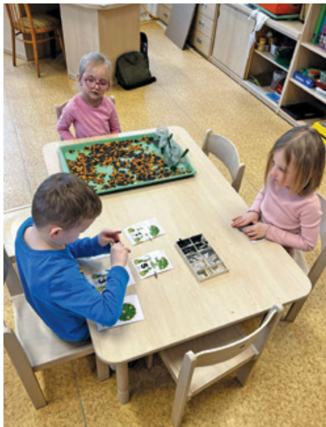
Myšky v pravěku