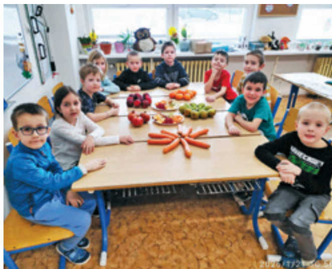
Ovoce do škol