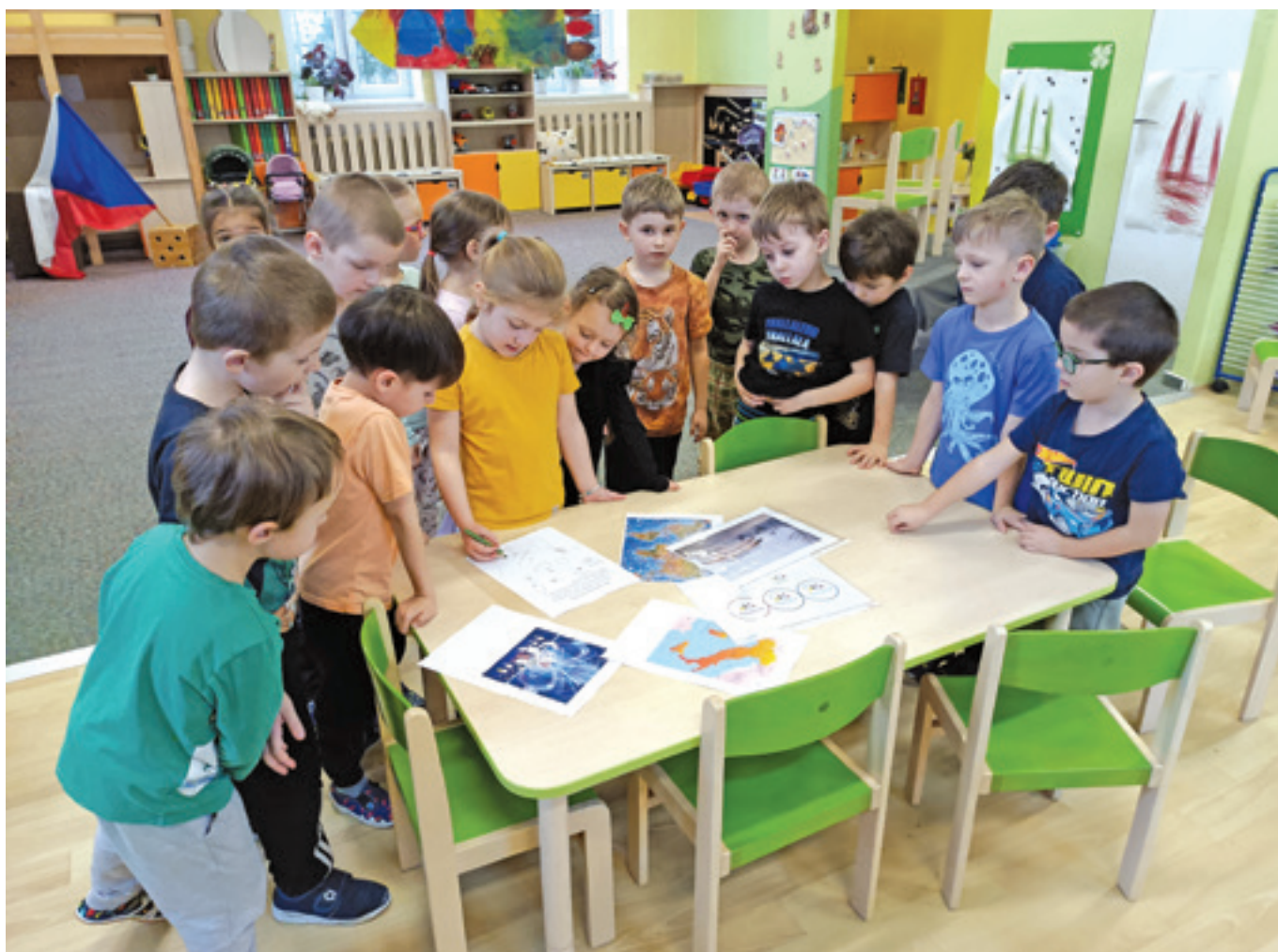
Autogramy na OH v Kotatech

ly si o zajímavostech ze světa ptactva. Na začátku měsíce je navštívil canisterapeutický pes Viki, což byla pro děti velká událost. Dozvěděly se, jak může pes pomáhat lidem, a samy si vyzkoušely různé aktivity – tvořily barevné kabátky pro dřevěné jezevčíky, skládaly řetěz z obojků a luštily psí puzzle. Nechyběl ani pohyb – děti si s Viki zacvičily, vyčesaly ji a samozřejmě ji pořádně „potulily“. Měsíc zakončily maškarním bálem plným her a soutěží.